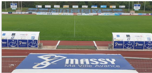
Stade Jules Ladoumègue (3 000 places) Pelouse naturelle