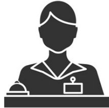
Hôtes & Hôtesses