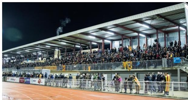
Tribune officielle pour intervention en extérieur (1 300 places assises couvertes)