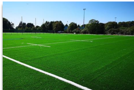
Stade d'entraînement (300 places) Terrain synthétique